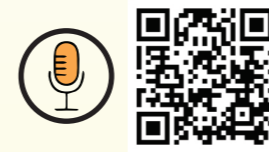
প্ৰসংবাদৰ QR কোড

অংশীদাৰসকলৰ সুবিধাৰ বাবে আয়কৰ আইন, 2025-ৰ খচৰা প্ৰস্তুতৰ লগত জড়িত বিষয়াৰ সৈতে "সংবাদ" অধিবেশনৰ লিংকৰ QR কোড তলত দিয়া হৈছে।