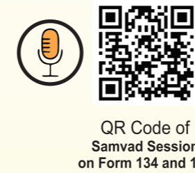
QR Code of Samvaad Session on Form 134 and 135

For the benefit of the Stakeholders, the QR code of the link to the “Samvaad” session with the officer involved in drafting of the Income Tax Act, 2025 is given hereunder :