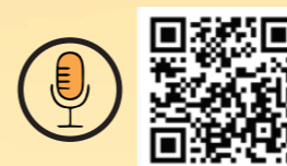
QR Code of Samvaad Session on Form 134 and 135

For the benefit of the applicants, the QR code of the link to the "Samvaad" session with the officer involved in drafting of the new Form is given at the bottom of the brochure. This may be referred for detailed discussion on the Form Nos. 134 and 135 (Erstwhile Form No. 49B) .