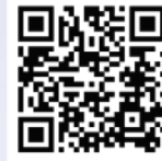
QR Code of Samvad Session on Form No. 95 and 96