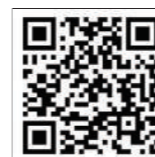
QR Code of Samvaad Session on Form 26