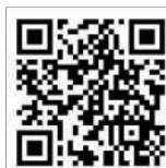
QR Code of Samvad Session on Form 112